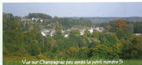
Vue sur Champagnac peu après le point numéro 5