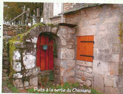
Puits à la sortie du Chassang

Parking et départ : place de l'église de Champagnac-La-Prune.