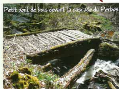
Petit pont de bois devant la cascade du Perbos