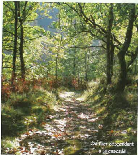
Sentier descendant à la cascade

Prendre la route passant devant l'église pour descendre au cimetière et sortir de Champagnac. Entrer dans "Le Perbos" et s'engager dans le premier chemin à gauche (direction "Cascade") + . Suivre le chemin principal jusqu'au panneau "Cascade" et descendre alors à gauche. Les lacets mènent à la cascade du Perbos. Traverser le petit pont de bois (ruines de l'ancien moulin) et remonter jusqu'à la D131 -2- . La longer à droite sur environ 700m puis monter dans le chemin à gauche -3- . Au croisement continuer à monter à droite et aller tout droit jusqu'au lieu-dit "Le Chassang" -4- . Traverser tout le village en restant sur la route principale. Au "cédez le passage" -5- , aller en face. Plus bas, le chemin débouche sur une petite route -6- . La suivre à droite jusqu'à la cascade du ruisseau de Amat -7- . Prendre alors à gauche pour passer devant l'ancien moulin (restauré en maison) et remonter à Champagnac. Après le restaurant -8- tourner à gauche pour rejoindre la place de l'église.